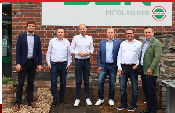
22. Mai – Mit den Verantwortlichen des Bauzentrums Westerstede habe ich mich über die soziale und wirtschaftliche Lage in der Bauwirtschaft ausgetauscht.