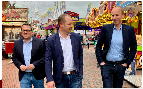
3. Mai – Markteröffnung mit Bonbonregen auf dem Westersteder Frühjahrsmarkt. Fahrgeschäfte, Attraktionen und Leckereien lockten viele Besucher an.