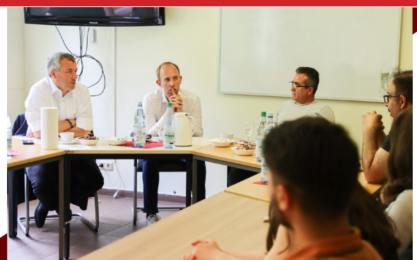
21. Mai – Beim Yezidisches Forum Oldenburg war ich mit Johann Saathoff MdB (l.) zu Gast. Mehr zu dem Austausch lest ihr auf Seite 4 unten.