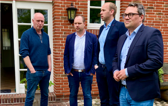
3. Mai – Zu Gast auf dem Hof Specht vor den Toren Westerstedes. Mehr über den Hof, das Thema Tierwohl und Biosiegel lest ihr auf Seite 4 oben.