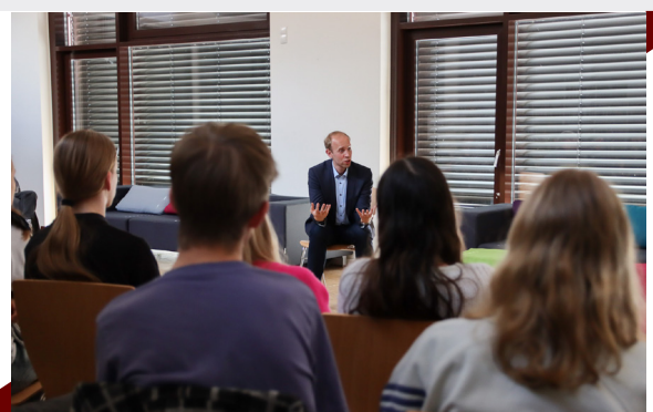
24. Mai – Zurück an meiner alten Schule, dem Neuen Gymnasium Oldenburg: Mit dem 11. Jahrgang durfte ich über aktuelle Politik diskutieren.